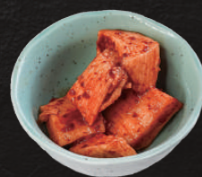
山芋キムチ 450円(税込)