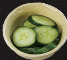
きゅうりの漬物 220円(税込)