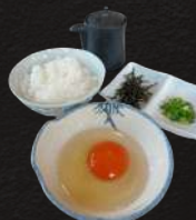
たまごかけご飯セット (龍のたまご使用)

(大)510円(税込) (中)450円(税込) (小)400円(税込) (単品)230円(税込)