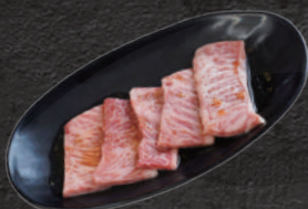
上バラ(三角バラ) 1,600円(税込)