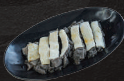
焼センマイ 880円(税込)