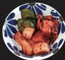
韓国キムチ盛合せ 650円(税込) (単品:大根、きゅうり、白菜)390円