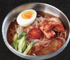
盛岡冷麺 (数量限定) 780円(税込)