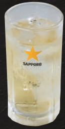
ハイボール 520円(税込) (濃いめ)800円 (メガ)980円