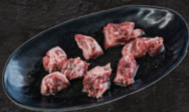
下駄カルビ 1,200円(税込)