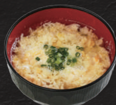
タマゴスープ 220円(税込)