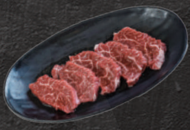
上ハラミ (人気No.1) 1,680円(税込)