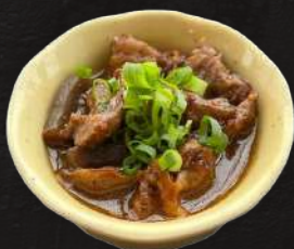
牛すじ味噌煮込み