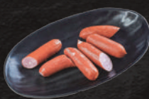
あらびきウィンナー 580円(税込)