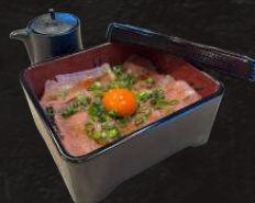
肉重 (龍のたまご使用)