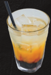
カシスマンゴー チューハイ 580円(税込)

ドライゼロ(ノンアルコール)..... 440 円(税込) グラスワイン(赤・白)..... 480 円(税込) かちわりワイン(赤・白)..... 480 円(税込) カシスみかん..... 550 円(税込) 梅酒(ロック、水割り、お湯割)..... 460 円(税込) 日本酒..... 450 円(税込)