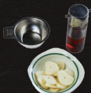
ニンニクスライス 500円(税込)