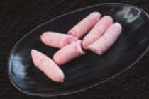
子ども用ウィンナー 580円(税込)