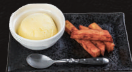
さつまいもアイス 450円(税込) 10分ほど掛かります

おかわりキャベツ 110円(税込) きざみネギ 110円(税込) カットレモン 110円(税込)