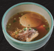
テールスープ 880円(税込)