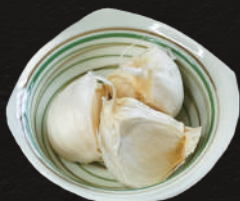
焼ニンニク 500円(税込)