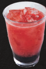
生グレカシス 600円(税込)