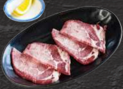
厚切り上塩タン(タン元) 1,650円(税込)