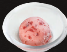
アイス・シャーベット 220円(税込) (バニラ・抹茶・チョコ・ユズ・イチゴ)