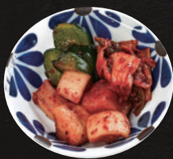
韓国キムチ盛合せ