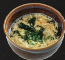
ワカタマスープ 350円(税込) 小サイズ280円