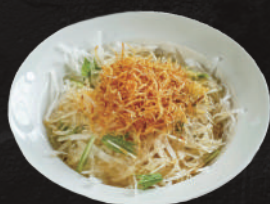
じゃがカリサラダ 400円(税込) (小) 220円