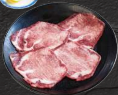
上塩タン(タン元) 1,650円(税込)