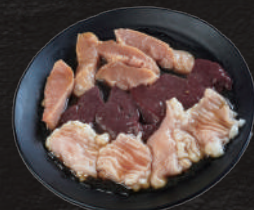
ホルモン盛合せ 2,500円(税込) (上ミノ, テッチャン, 焼ギモ)