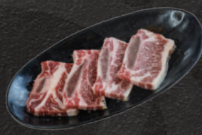
上骨付カルビ 1,500円(税込)