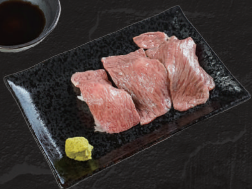
特選サーロインの 炙り肉ずし