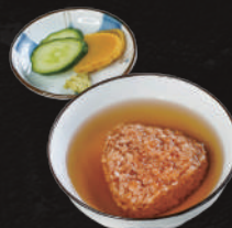
焼きおにぎりだし茶漬け