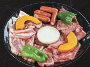
ファミリーセット

ロース、バラ、骨付きカルビ、タン、ミノ、焼野菜と(テッチャン、焼ギモ、センマイ)の内より、一品選んで下さい。