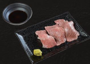
特選サーロインの 炙り肉ずし