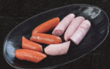
ウィンナー盛合せ 780円(税込)