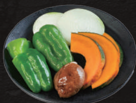
焼野菜盛合せ 400円(税込) (玉ねぎ、カボチャ、しいたけ、ピーマン)