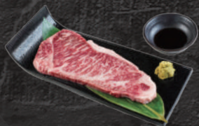
特選サーロイン ステーキ(150g~) 2,480円~(税込) (100g 1,650円)