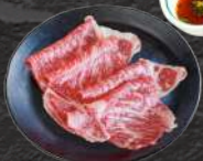
焼きしゃぶ (特選サーロイン) 1,650円(税込)