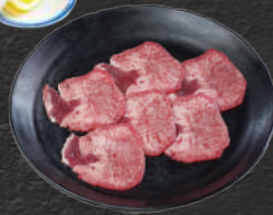
塩タン・厚切り塩タン 1,450円(税込)