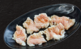
テッチャン 880円(税込)